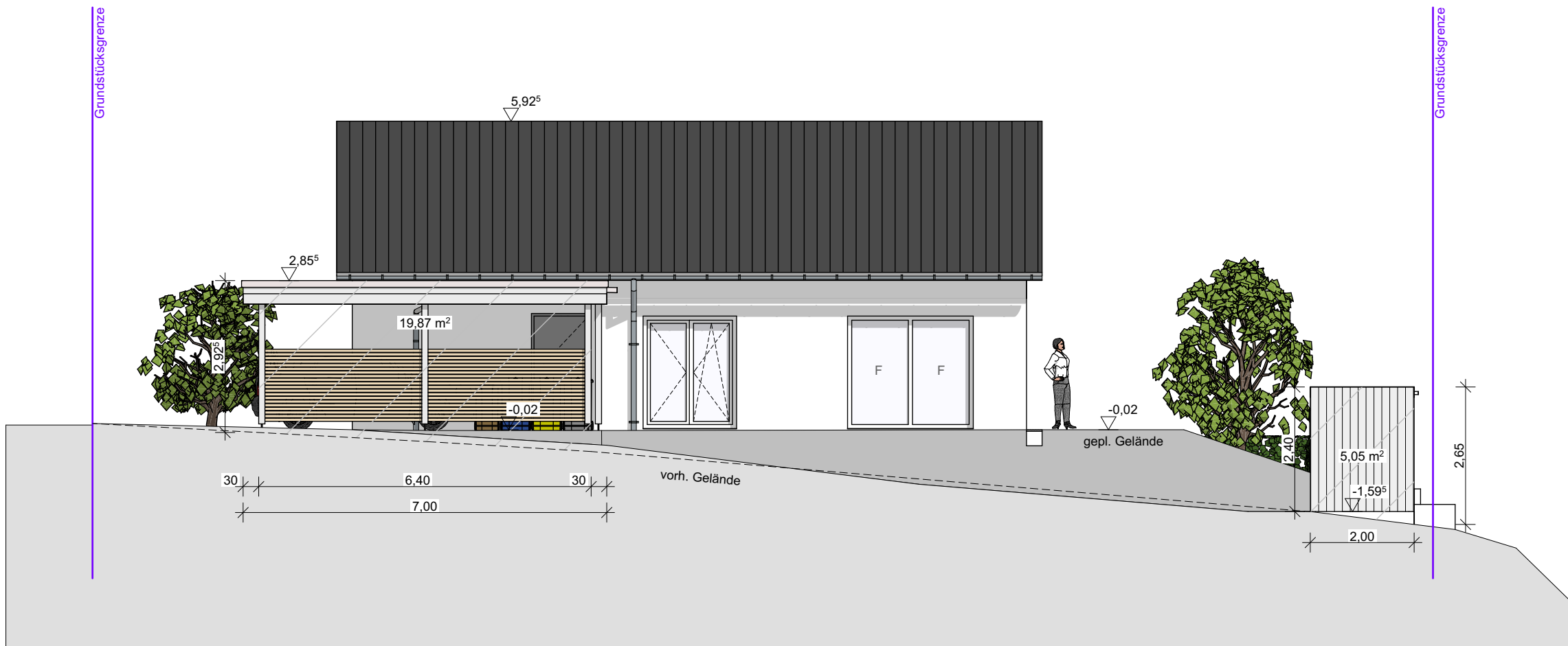
Ansicht Nord M 1:100