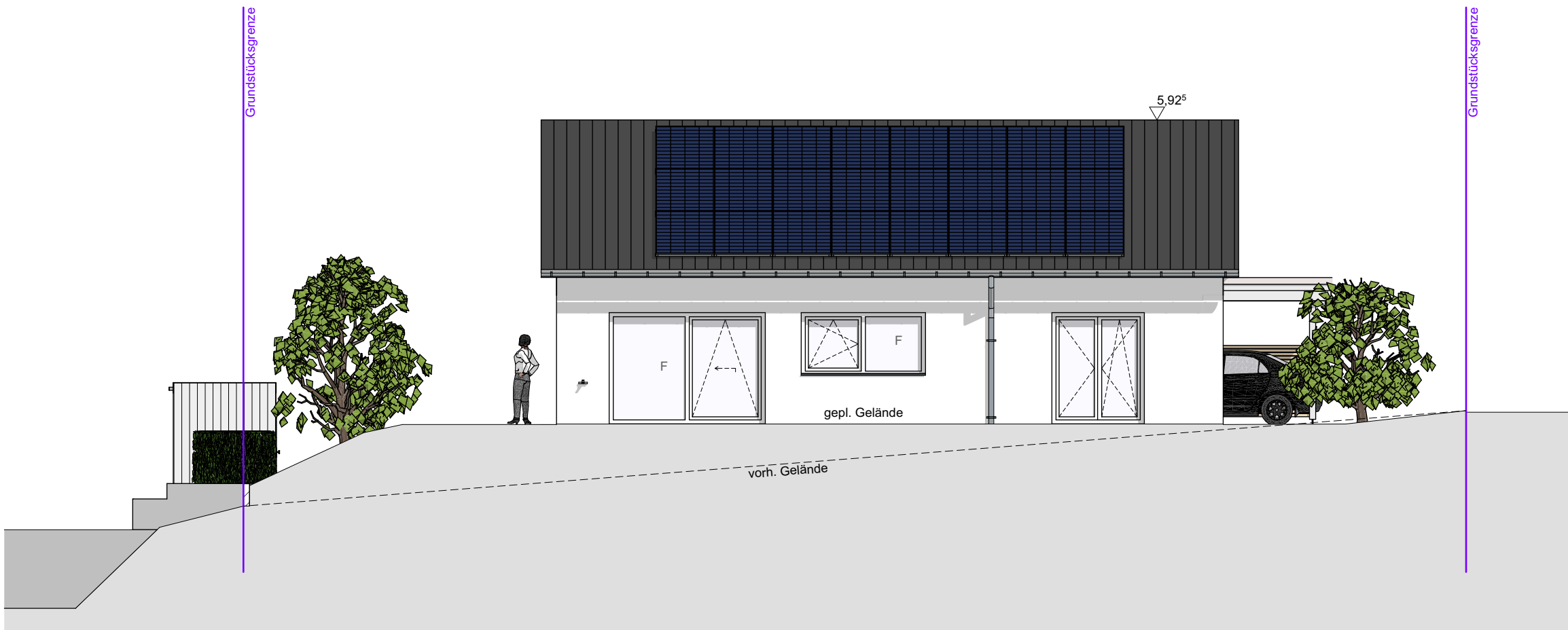
Ansicht Süd M 1:100